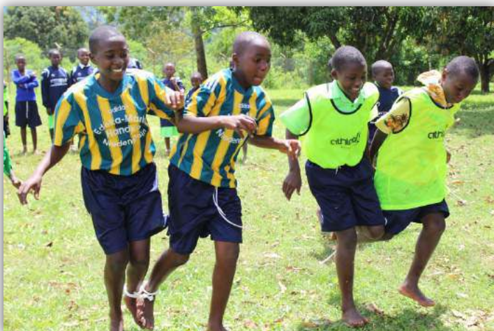
Auch in diesem Jahr organisierten die Freiwilligen wieder eine Hostel-Olympiade. Dank einer Sachspende durch den TSV Metze und den TUS Mingolsheim waren die Kinder dabei auch „klamottentechnisch“ gut gerüstet.