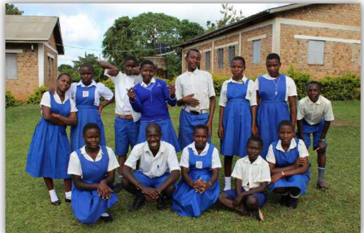
2017 waren es besonders viele Kinder, die nach 7 Jahren die Primary School abgeschlossen haben. Für alle 13 Kinder konnten wir Paten finden, die ihnen nun den Besuch der weiterführenden Schule ermöglichen.