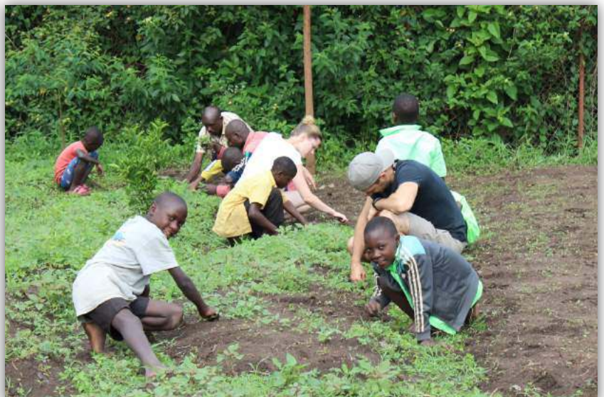
Unkraut jäten in den Gemüsegärten des Hostels – beim gemeinsamen Gärtnern können sowohl die Kinder als auch die Freiwilligen viel lernen.